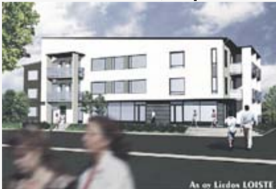
As oy Liedon LOISTE

Uusia laadukkaita kerrostaloasuntoja aivan Liedon keskustan palveluiden vieressä. Kohteen aloitus keväällä 2010 ja valmistuminen kesällä 2011.