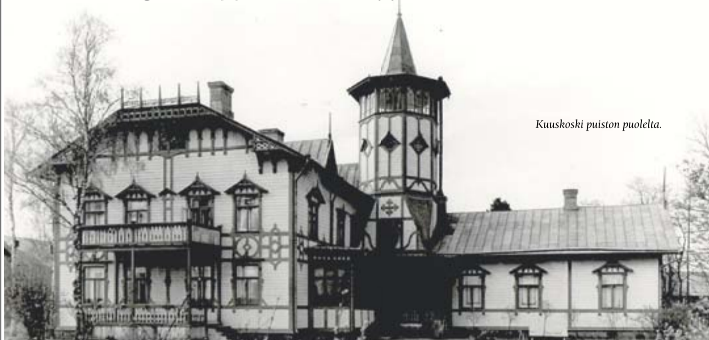
Kuuskoski puiston puolelta.