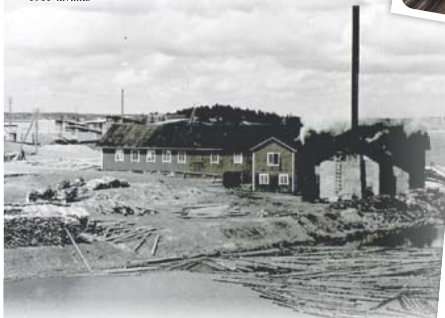
Auran saha 1930-luvulla.