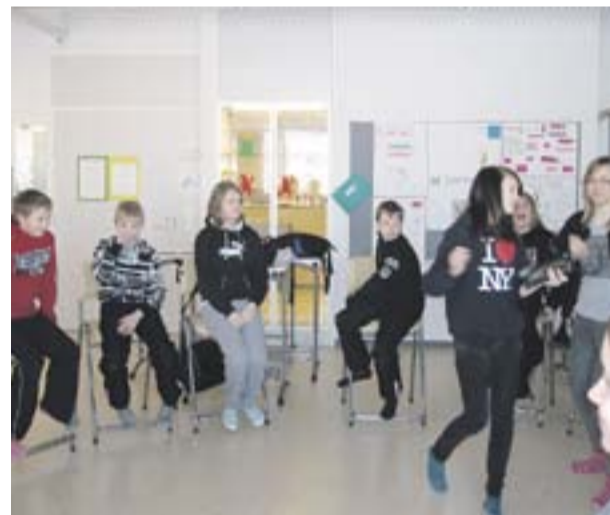
Kuvat ylhäältä alas:

Kahden päivän aikana saimme valtavan määrän pieniä, mutta toimivia käytännön vink- kejä koulun arkeen, esimerkkeinä erilaiset tavat jakaa oppilaat ryhmiin, hiljaisuusmerkki ja so- siaalisia taitoja kehittävä leikit ja harjoitukset. Olemme ottaneet Lions quest -ohjelman luokis- samme käyttöön ja soveltaneet useita toimintata- poja myös tavallisilla oppitunneilla, esimerkiksi äidinkieliessä ja liikunnassa. Viereisistä kuvista voi nähdä tunnelmia Lions quest -tunnilta.