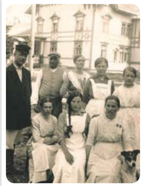
Kartanon palvelusväkeä 1910-luvulla.